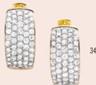
27. Collier | Necklace* € 149 · 28. Collier | Necklace* € 199 · 29. Collier | Necklace*** € 169 · 30. Ohrschmuck | Earrings* € 159 31. Ring*** € 169 · 32. Ring* € 129 · 33. Ring* € 199 · 34. Ohrschmuck | Earrings* € 199 * Gelbgold plattiert | yellow-gold-plated · ** Süßwasserperle | freshwater pearl